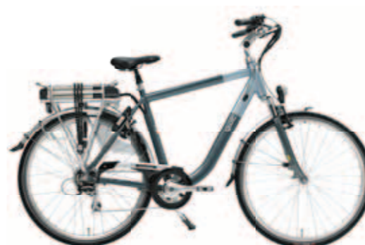
Trend² € 1399,-