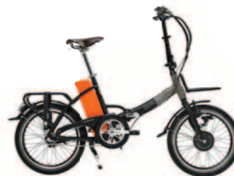
Smart-e³ URBAN € 1499,-