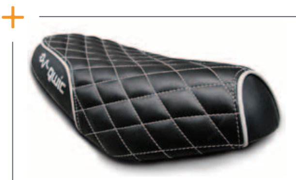
Custom scooterzadel va. € 249,-