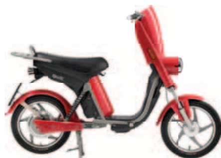
Emoto Lite € 1299,-