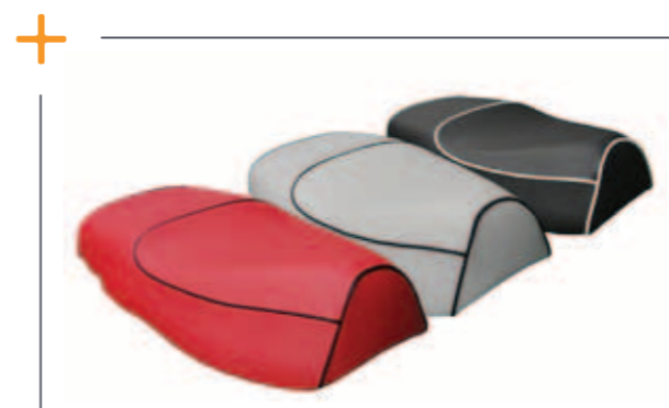
Speciaal zadel emoto 87 € 99,-