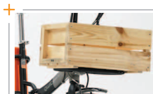
Houten krat € 49,95