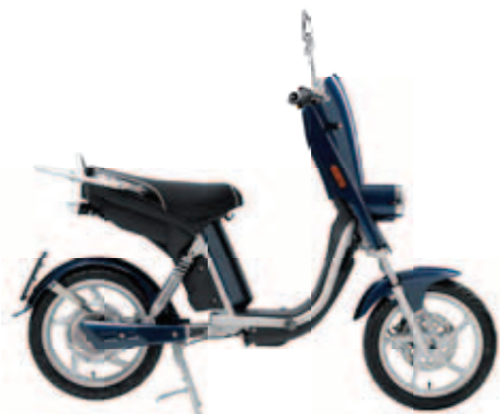
Emoto Lite SL vanaf € 2299,-