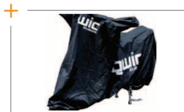
Beschermhoes € 69,50