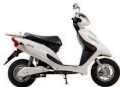
Emoto 80duo vanaf € 1895,-