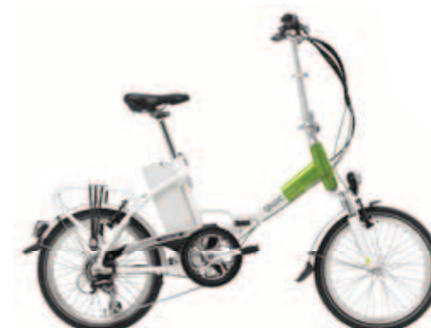
Smart-e³ € 1399,-