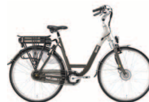
Trend² NX7 € 1599,-