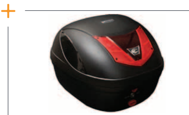
Opbergbox luxe € 119,-