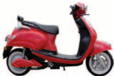
Emoto 87 S-gel: v.a. € 2199,- Li-ion v.a. 3299,-