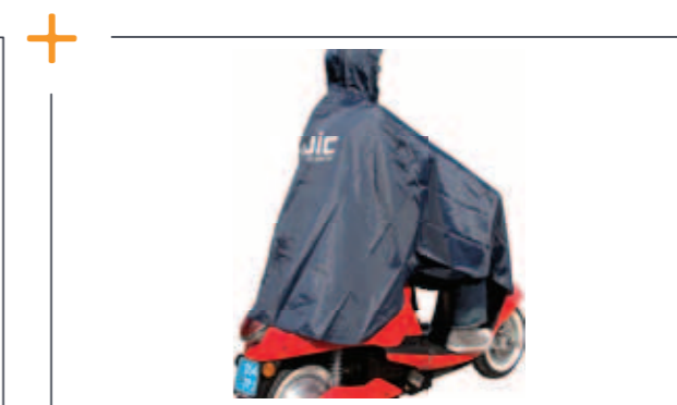
Regen poncho € 49,95