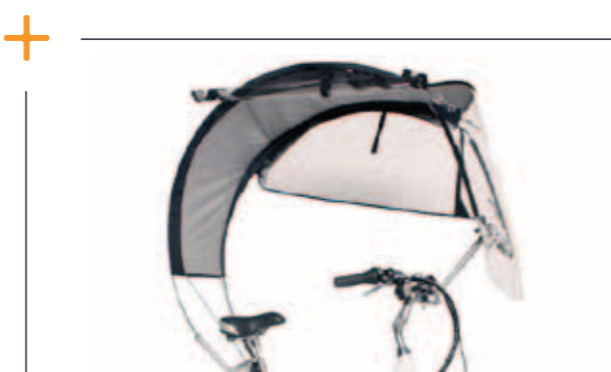
Veltop € 199,-