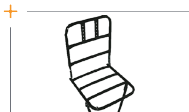
Voorrekje Lite € 74,95