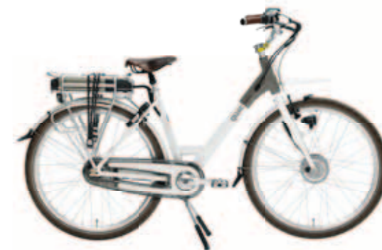
URBAN € 1499,-