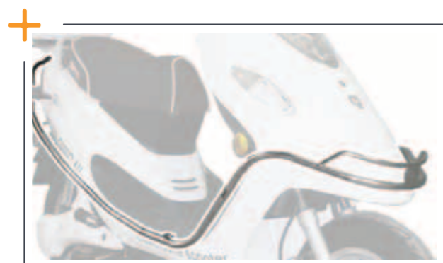
Beschermbegel (Alleen Emoto 80duo) € 99,-