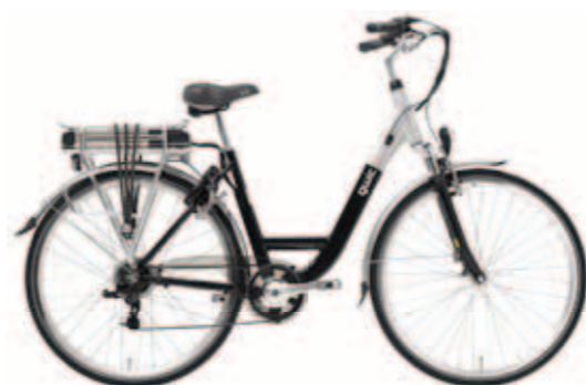
Base² € 999,-