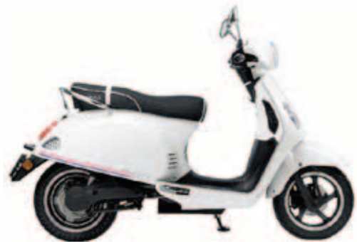
Emoto StreetCity vanaf € 2799,-