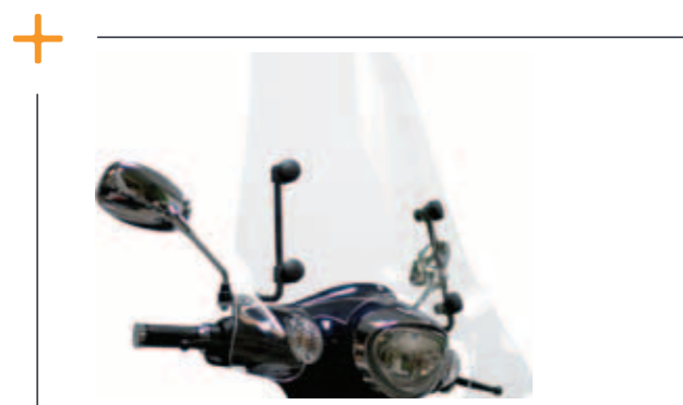
Full-size windscherm € 139,-