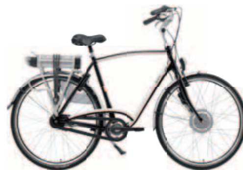
Alpha € 1999,-